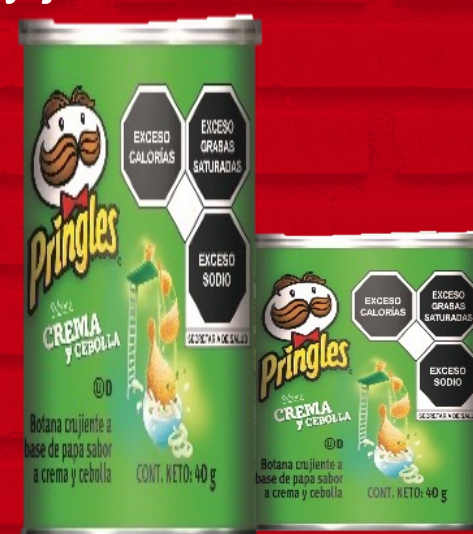
Pringles C&C 40grs.