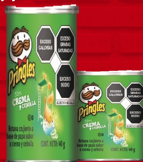
Pringles C&C 40grs.