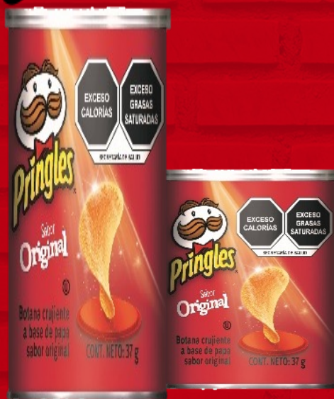
Pringles Original 37grs.