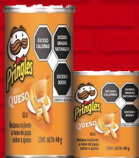
Pringles Queso 40grs.