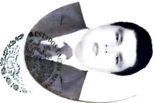
SISTEMA EDUCATIVO NACIONAL