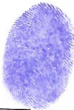
DISTRIBUIDORA EL TORO, S. A. DE C. V.