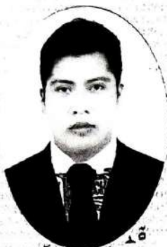
AUTÓNOMA DIRECCIÓN DE SERVICIOS ESCOLARES