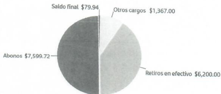
Gráfico cuenta de cheques.

Saldo inicial 47.22 + Depósitos 7,599.72 - Retiros 7,567.00 = Saldo final 79.94