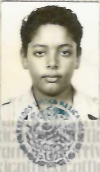
SISTEMA EDUCATIVO NACIONAL YUCATAN